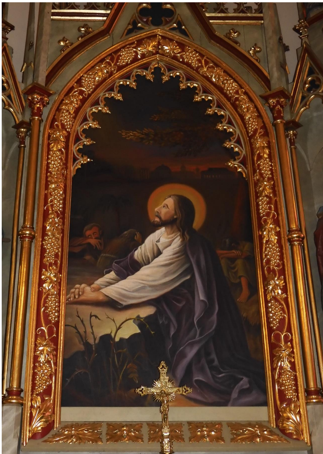
Fot. nr 7. Porąbka, kościół p.w. Narodzenia Najświętszej Marii Panny, ołtarz przyścienny Najświętszego Serca Pana Jezusa - zasuwana ołtarzowa, obraz olejny, stan przed konserwacją z marca 2023 r.