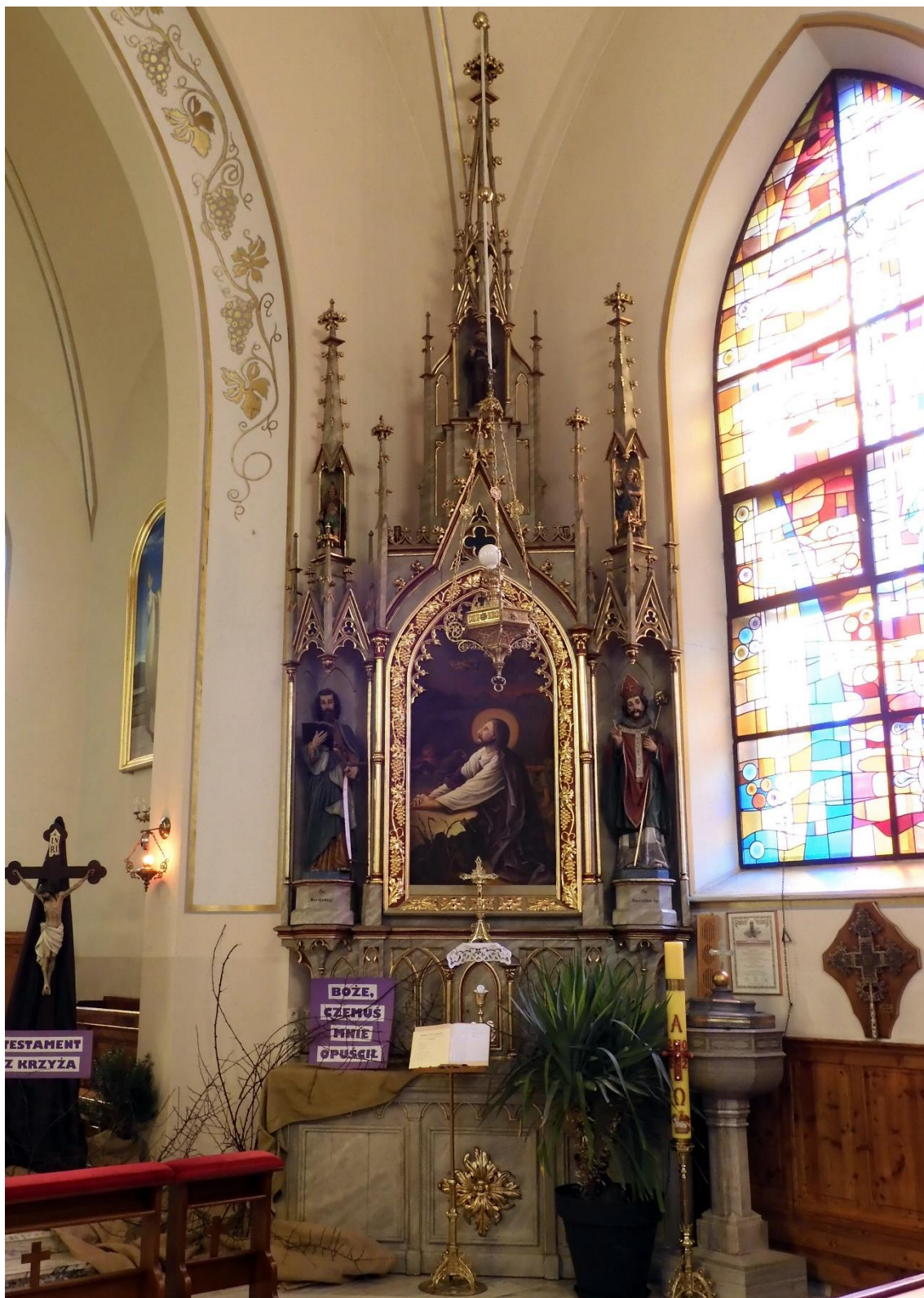
Fot. nr 2. Porąbka, kościół p.w. Narodzenia Najświętszej Marii Panny, ołtarz przyścienny Najświętszego Serca Pana Jezusa - prawa strona nawy, stan przed konserwacją z marca 2023 r.