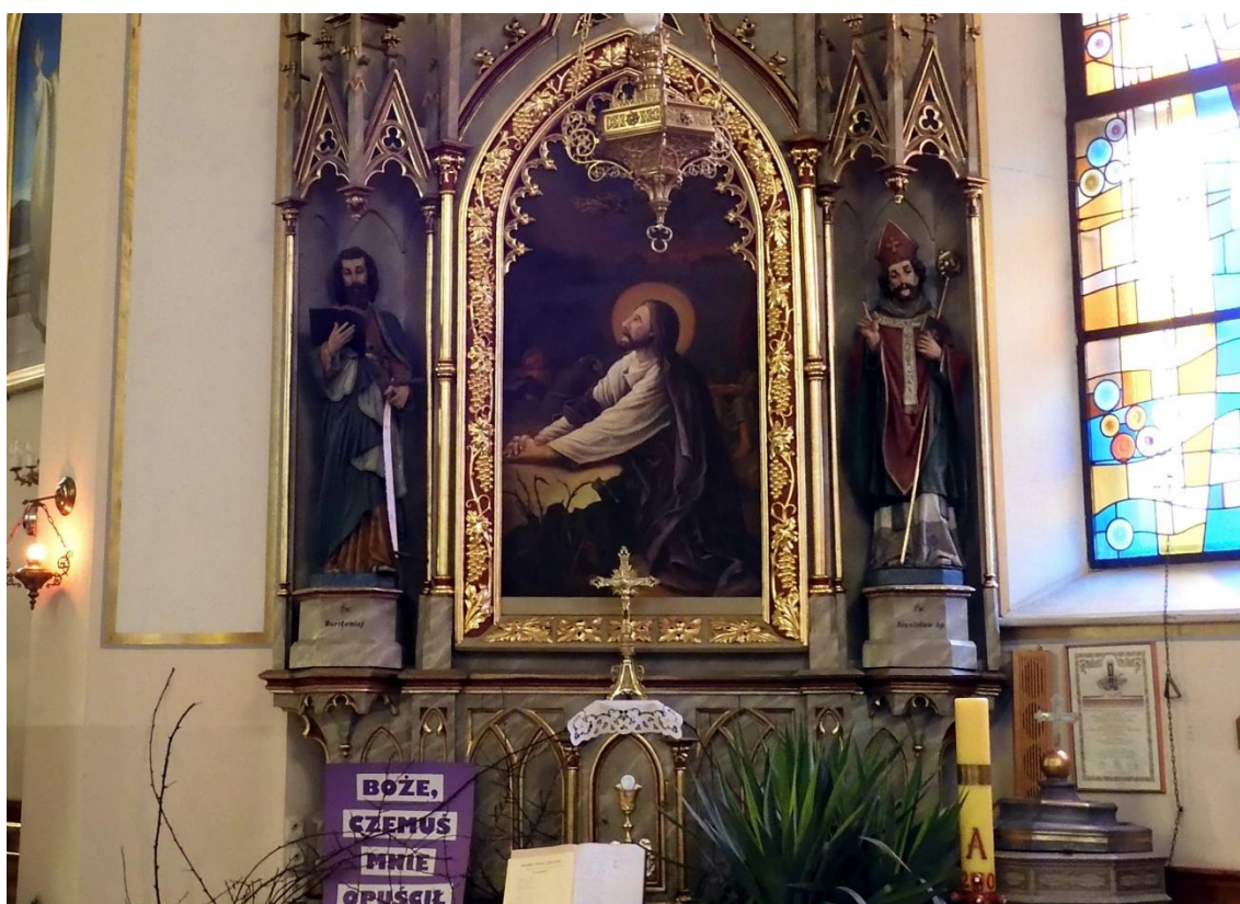
Fot. nr 3,4. Porąbka, kościół p.w. Narodzenia Najświętszej Marii Panny, ołtarze przyścienne boczne – środkowa część ołtarzy, stan przed konserwacją z marca 2023 r.