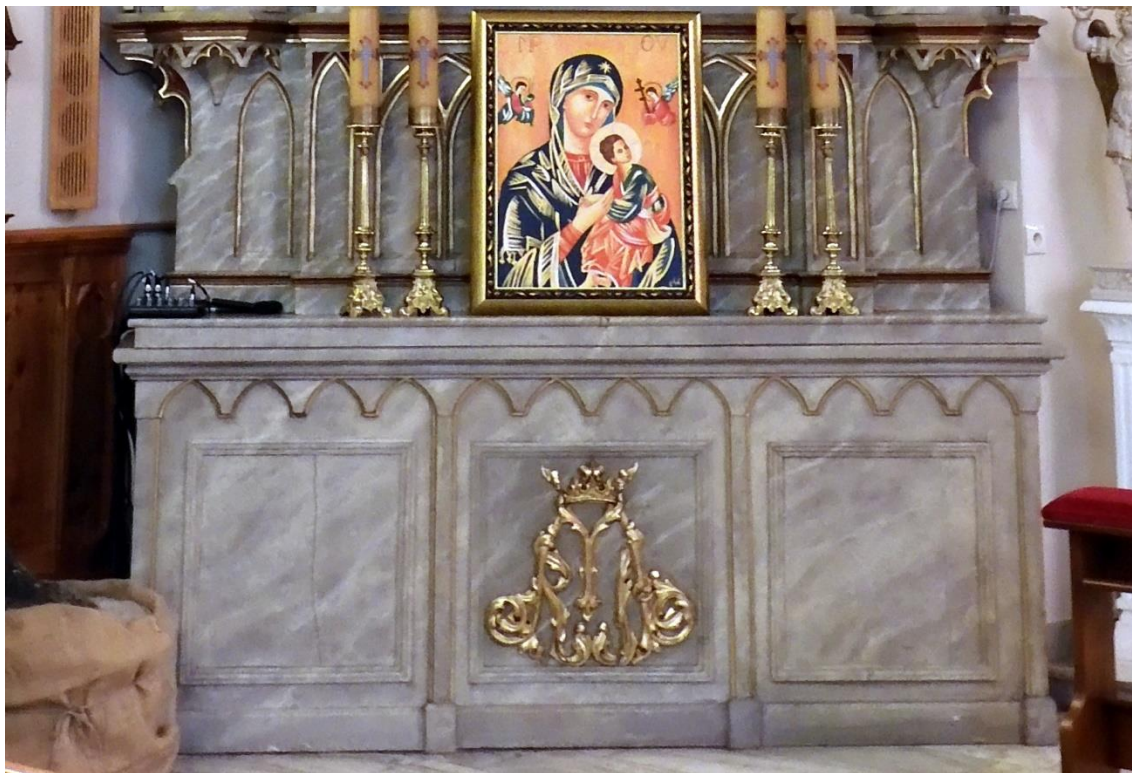
Fot. nr 6. Porąbka, kościół p.w. Narodzenia Najświętszej Marii Panny, ołtarz przyścienny Niepokalanego Poczęcia Najświętszej Marii Panny – mensa i predella, stan przed konserwacją z marca 2023 r.