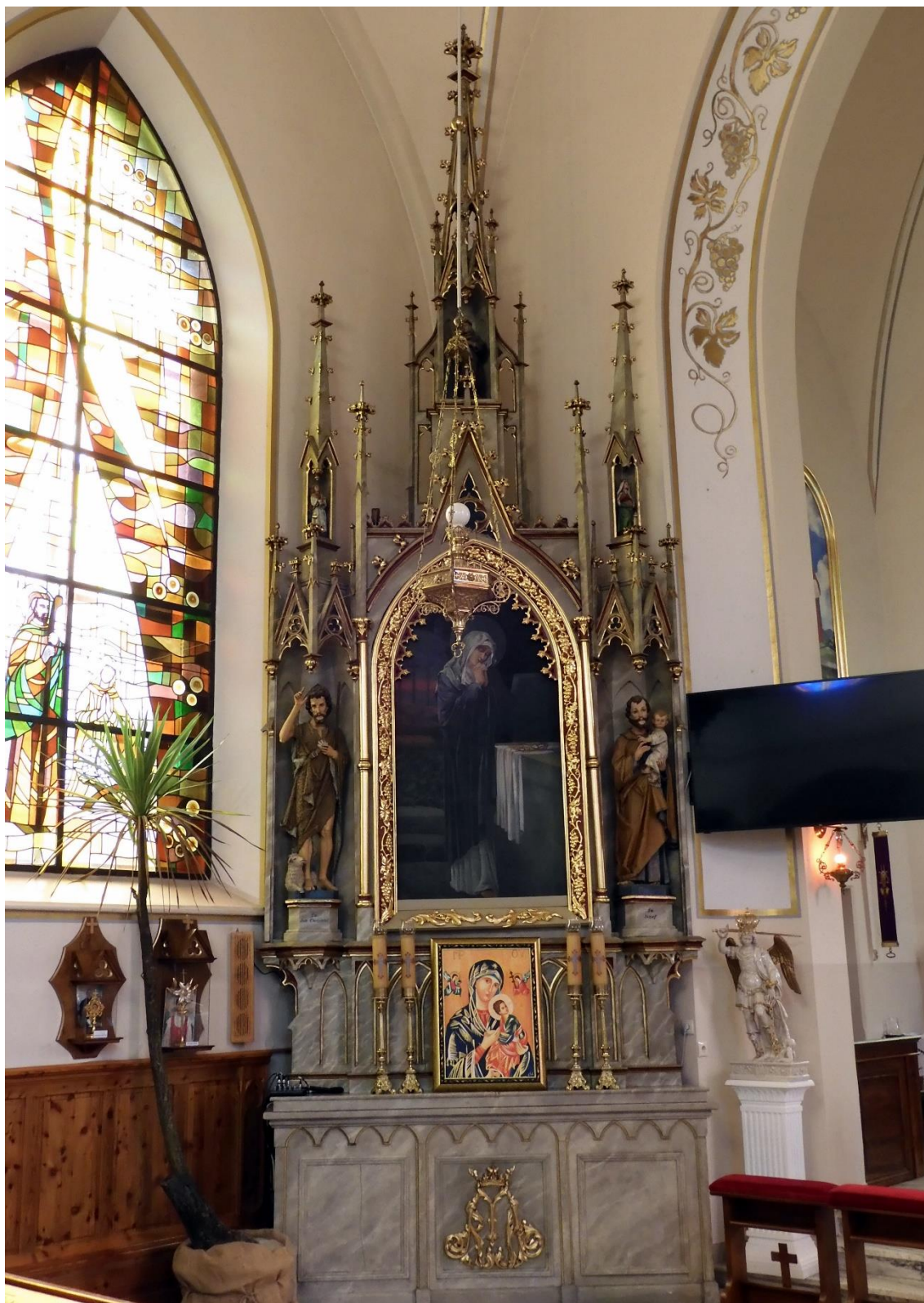
Fot. nr 1. Porąbka, kościół p.w. Narodzenia Najświętszej Marii Panny, ołtarz przyścienny Niepokalanego Poczęcia Najświętszej Marii Panny – lewa strona nawy, stan przed konserwacją z marca 2023 r.