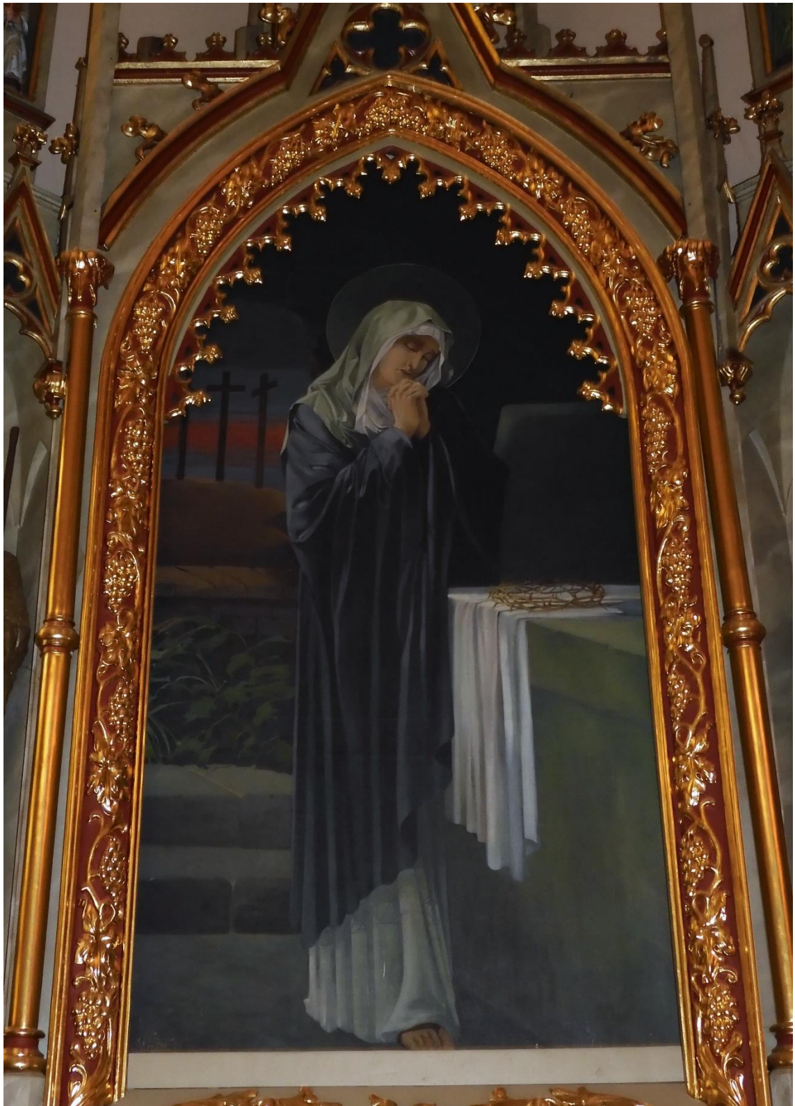
Fot. nr 8. Porąbka, kościół p.w. Narodzenia Najświętszej Marii Panny, ołtarz przyścienny Niepokalanego Poczęcia Najświętszej Marii Panny – zaszuwa ołtarzowa, obraz olejny, stan przed konserwacją z marca 2023 r.