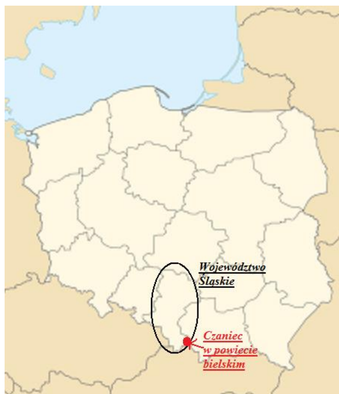
Mapa 1 Lokalizacja miejscowości Czaniec w skali kraju

Miejscowość Czaniec, o powierzchni 1691 ha, leży w południowej części województwa śląskiego, wschodniej części powiatu bielskiego. Od północy graniczy z gminą Kęty – leżącą w powiecie oświęcimskim (woj. małopolskie), od wschodu z gminą Andrychów – leżącą w powiecie wadowickim (woj. małopolskie), od zachodu z sołectwem Kobiernice, od południa z miejscowością Porąbka. Wieś leży nad rzeką Sołą u podnóży Beskidu Andrychowskiego (wschodnia część Beskidu Małego).