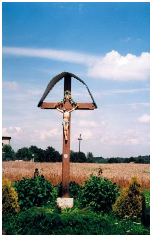
Zdjęcie 2 Krzyż drewniany w Czańcu

Obecnie na terenie Gminy Porąbka obowiązuje Miejscowy Plan Zagospodarowania Przestrzennego Gminy Porąbka przyjęty Uchwałą Nr XXVIII/185/09 z dnia 11 marca 2009 r.