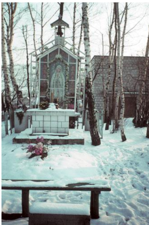
Zdjęcie 1 Kapliczka Matki Boskiej Fatimskiej