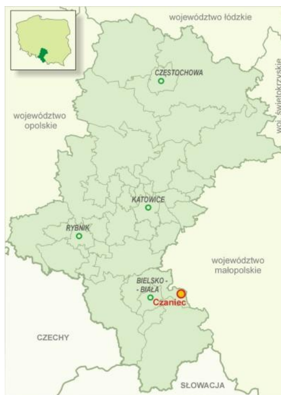
Mapa 2 Lokalizacja miejscowości Czaniec w skali Województwa Śląskiego