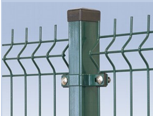
Rys. Nr 1