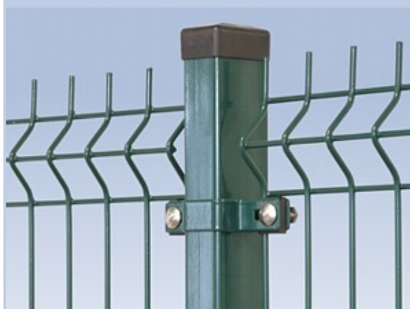
Rys. Nr 1