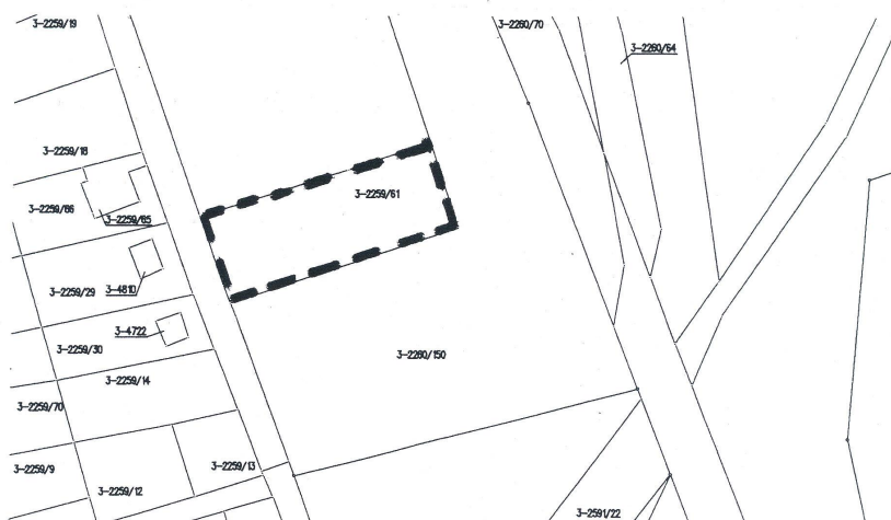
sołectwo Kobiernice – granica obszaru